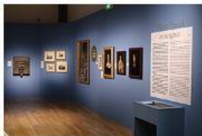
Blaise Pascal auvergnat