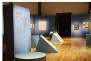
L'entrée de l'exposition